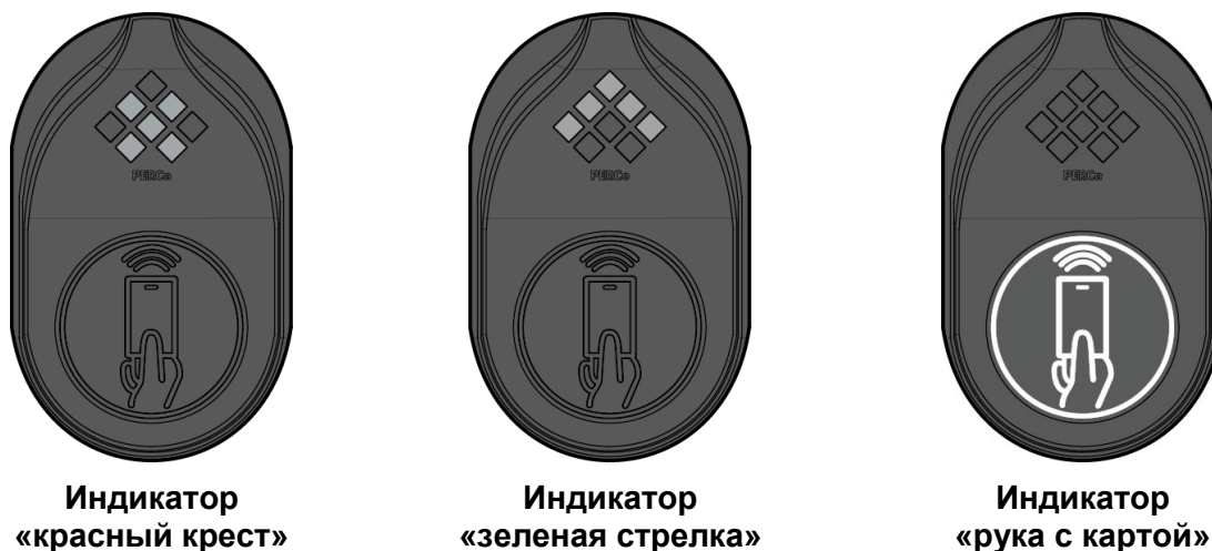
Рисунок 2. Индикаторы блока индикации

Кроме того, ЭП снабжена индикатором «строка», расположенным на переднем торце крышки стойки. Индикатор предназначен для дополнительного информирования пользователя о запрете или разрешении прохода через ЭП.