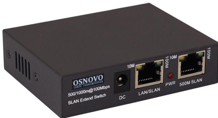
Рис.1 Удлинитель TR-IP1(800м) (общий вид)