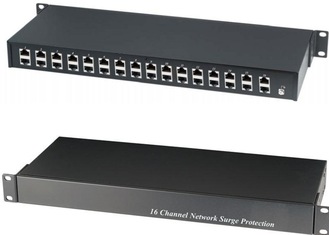
Рис.1 Внешний вид SP016P / SP016N .