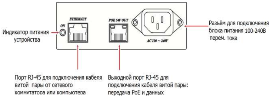
Рис.3 Разъёмы инжектора IP06I.