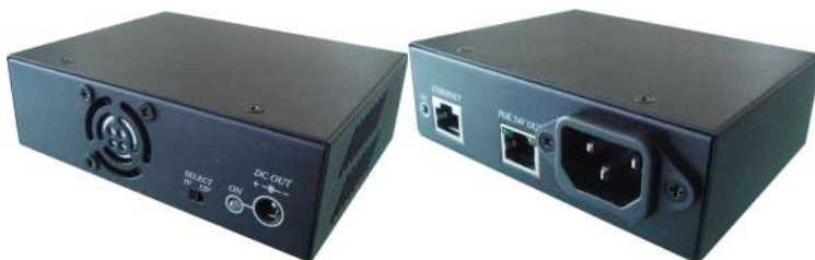
Рис.1 Внешний вид инжектора IP06I и сплиттера IP06S.