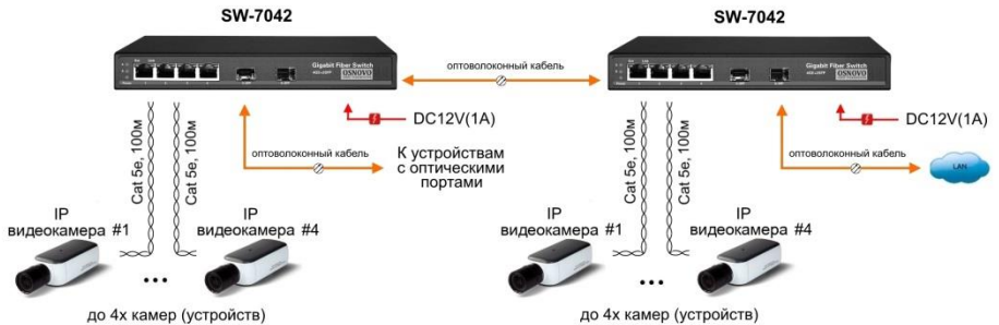
Рис.5 Схема каскадного подключения коммутатора SW-7042