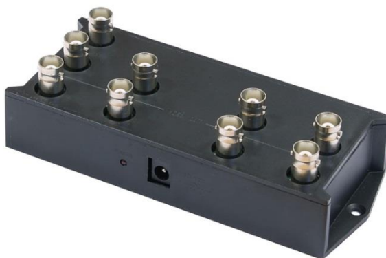
Рис.1 Разветвитель D-H108, внешний вид